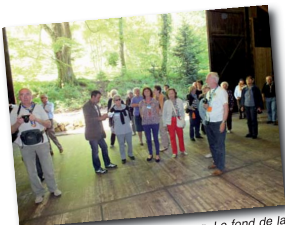
Le théâtre du peuple de Bussang. Le fond de la scène s'ouvre sur la forêt vosgienne.

C'est un idiomme qui a aussi une portée publique : il renvoie à la position institutionnelle des éclés dans l'arène publique de l'éducation post-scolaire, associés aux autres mouvements laïques de l'éducation populaire. L'évolution des significations de la citoyenneté dans le scoutisme laïque depuis 1911 et jusqu'à Villeneuve en 2006 confirme la portée symbolique de cet élément de culture : unifier des engagements dans l'espace et le temps ; célébrer l'existence publique d'un mouvement de classe moyenne dont le pouvoir est fondé sur une compétence pédagogique.