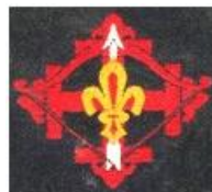
H: 1941, insigne fédéral tissé

C'en est fini, pour ces deux mouvements, de la singularité française : une symbolique républicaine et laïque. Sur l'insigne fédéral du Scoutisme Français (SF) en 1941, seul l'Arc tendu a gardé son âme d'enfant (H).