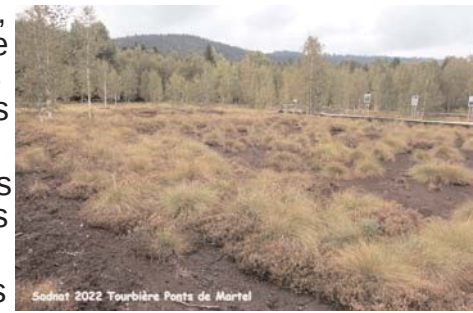
Sadnat 2022 Tourbière Ponts de Martel

Comme à chaque Sadnat, nous étions répartis en trois groupes, les marcheurs, les promeneurs et les visiteurs.