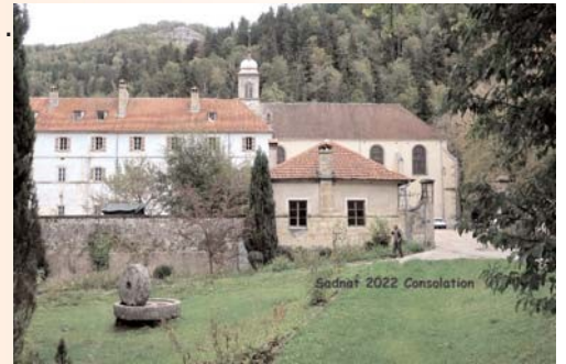
Sadnat 2022 Consolation