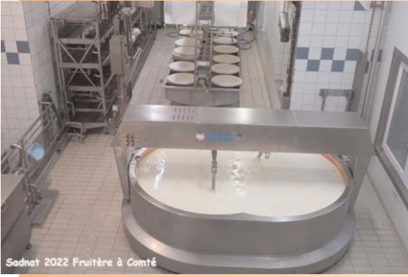
Sadnat 2022 Fruitière à Comté