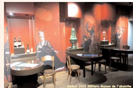
Sadnat 2022 Môtiers-Maison de l'absinthe

Puis notre odorat a été flatté par les effluves à l'intérieur de la Maison de l'absinthe à Môtiers, ainsi que notre palais lors de la dégustation après la visite du lieu.