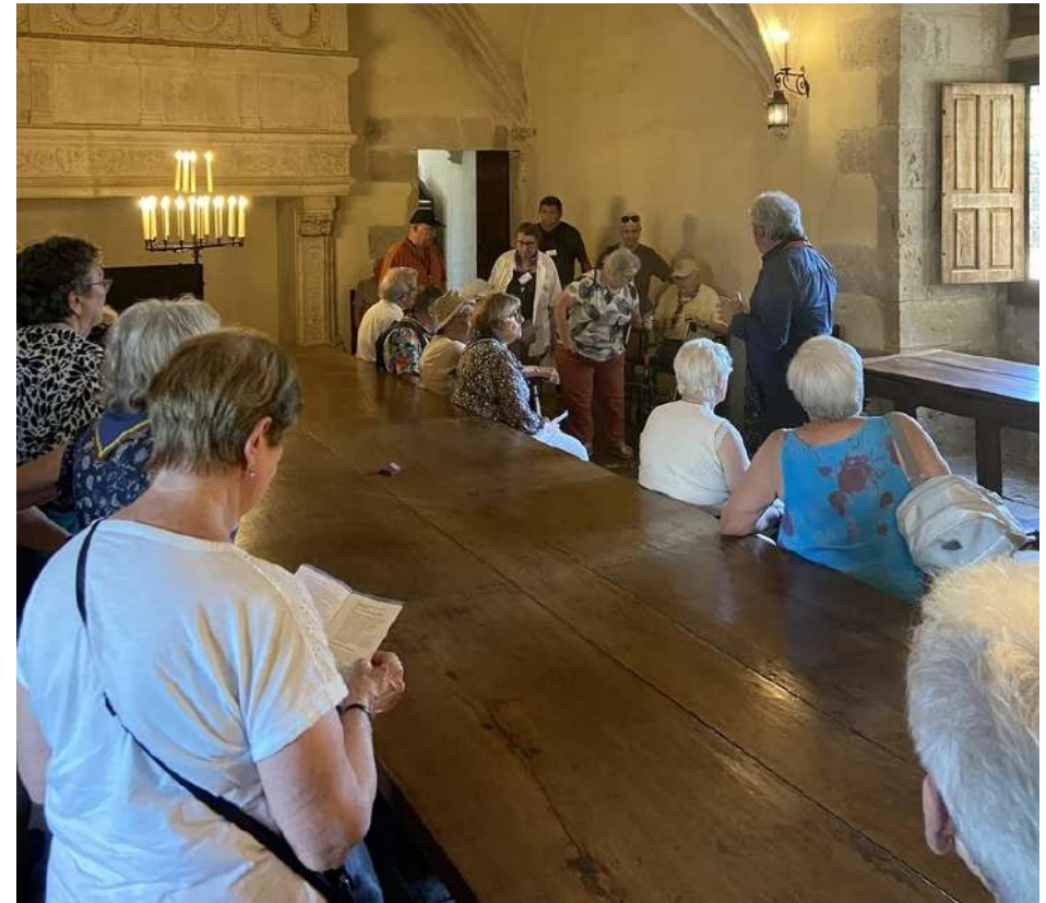
Mercredi 27 mai 2026 le Chateau de Montal