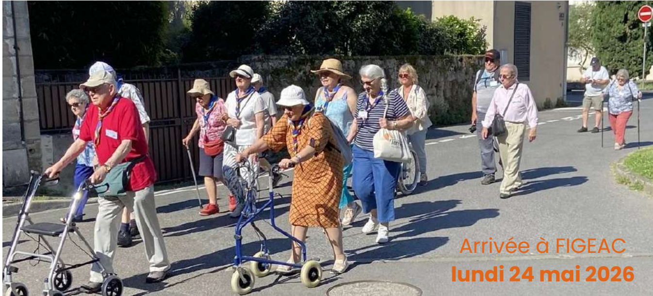
Arrivée à FIGEAC lundi 24 mai 2026