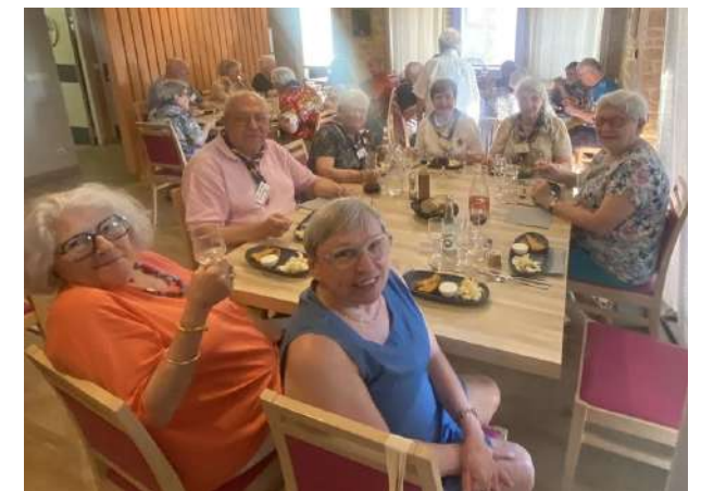
Samedi 23 mai 2026 l'arrivée de tous les AAEE et partage du premier repas