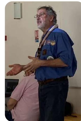
Rapport moral - comptes - commissaire aux comptes - Actualité des EEDF par Alain