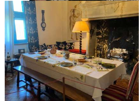
Mercredi 27 mai 2026 visite du château de Saint Laurent les Tours - Musée Lurçat