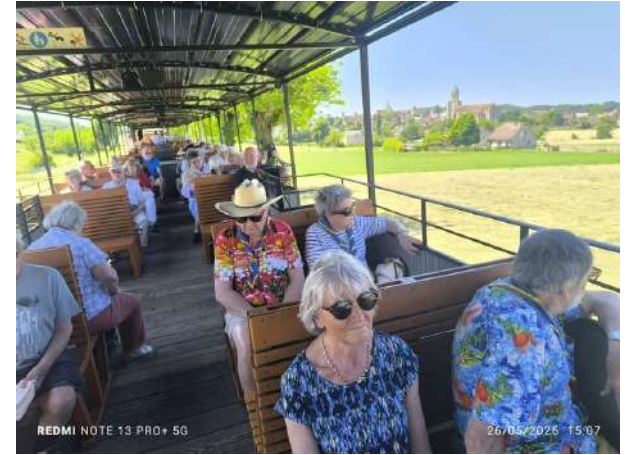
Village de MARTEL "attention au départ !" voyage en train touristique