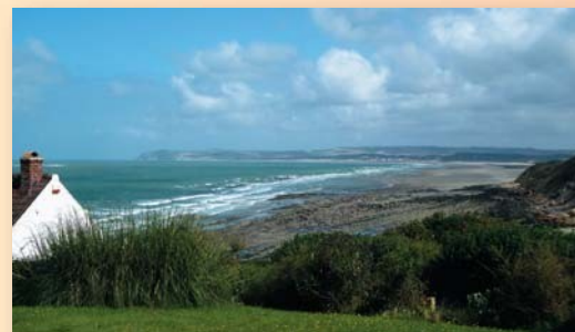
Vue sur le Cap Gris-Nez du Blanc-Nez

Point de France le plus proche de la Grande Bretagne visible parfois à l'horizon, limite où s'affrontent les eaux de la Manche et de la mer du Nord, face au détroit le plus fréquenté du monde par d'innombrables bateaux.